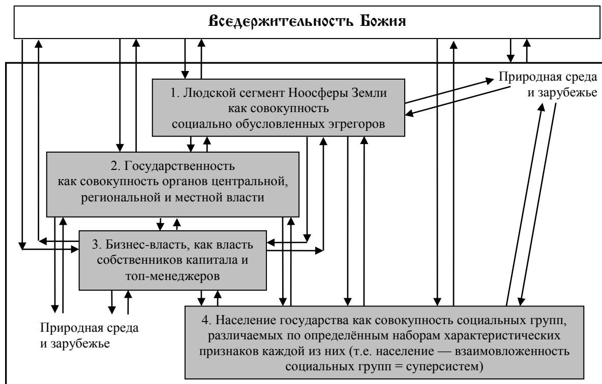
Рис. 1. Схема взаимосвязей частных процессов управления в режиме «автопилота матрично-эгрегориального управления»

Аналитическая записка ВП СССР «Правдив и свободен их вещей язык и с Волей Небесною дружен...» была посвящена объективно наличествующим возможностям и процессам, стоящим в объективной реальности за схемой, представленной на рис. 1 1 .