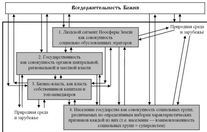
Рис. 1. Схема взаимосвязей частных процессов управления в режиме «автопилота матрично-эгрегорального управления»

На рис. 1 линии со стрелками обозначают направленность информационных потоков в прямых и обратных связях контуров управления, поддерживаемого соответствующими субъектами и самоуправляющимися объектами. Соответственно, для того, чтобы понимать эту схему и прочувствовать стоящие за нею в объективной реальности возможности и процессы, необходимо знать достаточно общую (в смысле универсальности применения) теорию