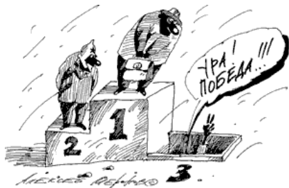
Рисунок Алексея Меринова 1

достоинства и на интеллект 3 надо опираться в этих условиях. Люди, я к вам, лидеры партий, обращаюсь: объединяйтесь! Переходите от слов к делу...»